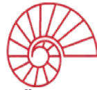
Özel Koç Lisesi