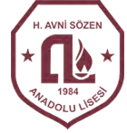
Hüseyin Avni Sözen Anadolu Lisesi